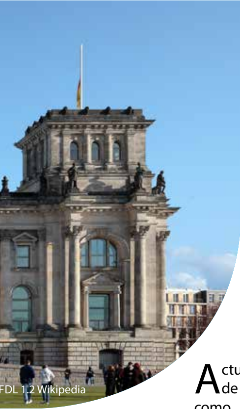
FDL 1,2 Wikipedia